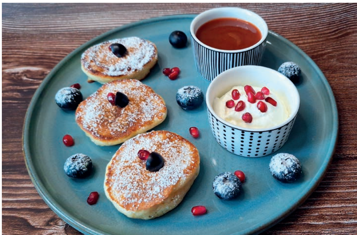
Ein süßer Genussmoment: Liwanzen mit Zwetschkenmarmelade, Sauerrahm und frischen Beeren.

2 Eier 1/2 Packerl Germ 225 ml lauwarme Milch 250 g glattes Weizenmehl 40 g Staubzucker 1 Prise Salz Butter oder Öl zum Braten Zimtzucker Powidl oder Sauerrahm