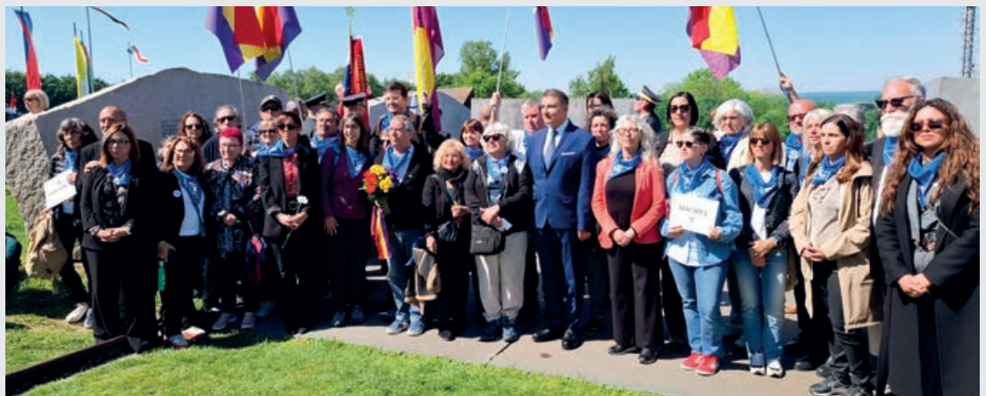
Der Obmann des Kulturvereins österreichischer Roma (Mitte) beim Mahnmal für Roma und Sinti mit einer spanischen Delegation.

Die Gedenk- und Befreiungsfeier 2026 widmet sich dem Thema „Täter und Täterinnen im Nationalsozialismus“. Das nationalsozialistische Lagersystem, zu dem auch der KZ-Komplex Mauthausen gehörte, funktionierte nicht nur durch die Befehle von oben. Täterinnen und Täter agierten auf unterschiedlichen Ebenen – von unmittelbarer Gewaltanwendung bis zur administrativen Unterstützung des Mordprogramms. 11.00 Uhr: Beginn der Internationalen Befreiungsfeier in der KZ-Gedenkstätte Mauthausen.