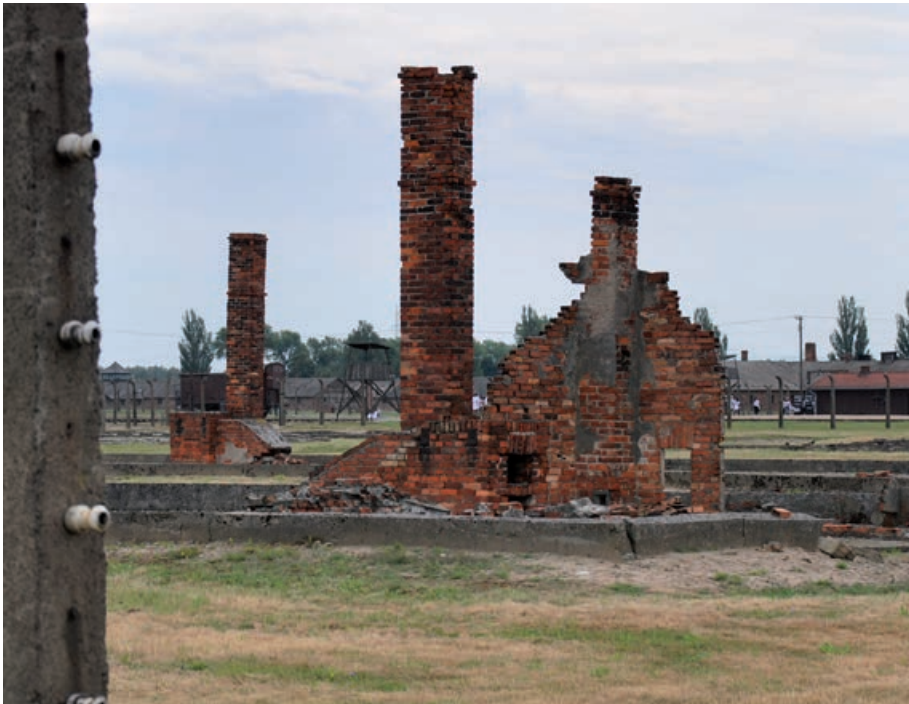
Reste der Baracken.