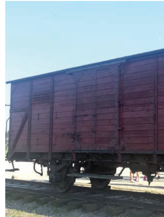
Waggon eines Deportationszuges.